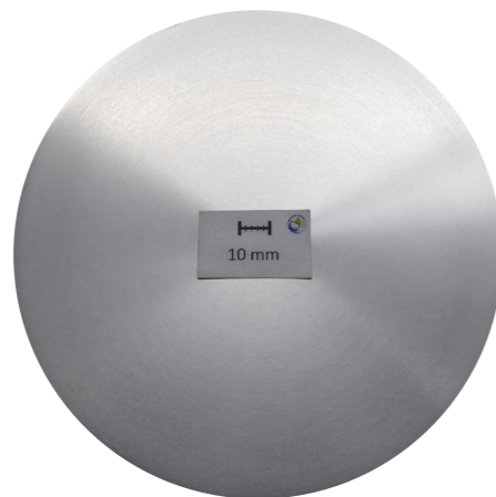
Makroschliff, d178 mm: Seigerungszone 2 mm

Prozessbedingt tritt an stranggegossenen Barren in der Randschicht direkt eine Seigerungszone auf. Vor der Weiterverarbeitung ist diese zu entfernen – bei Barren von LEICHTMETALL ist das bereits schon der Fall. Auf Kundenwunsch durchlaufen die abgedrehten Barren eine abschließende Qualitätsprüfung (automatische Ultraschall-Prüfung unter Wasser). Werden Gießlängen bezogen, ist die Tiefe der Seigerungszone hier beispielhaft am Durchmesser 178 mm dargestellt.